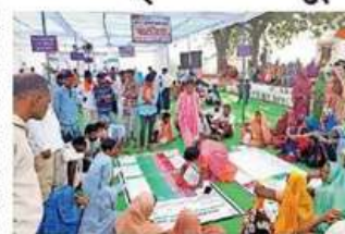
कुमलगढ़, स्वराज पदयात्रा में प्रदर्शनी का अवलोकन करते अतिथि।